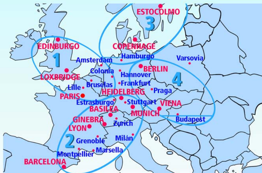
Figura 1 Propuesta de metabioclústers europeos. 1: EuroBioWest; 2: EuroBioSouth; 3: EuroBioNorth; 4: EuroBioEast

La iniciativa ScanBalt, único metaclúster real en funcionamiento, abarca la mayoría de países nórdicos: Dinamarca, Suecia, Finlandia, Noruega, Islandia, Norte de Alemania, Polonia, Letonia, Estonia, Lituania y oeste de Ru-