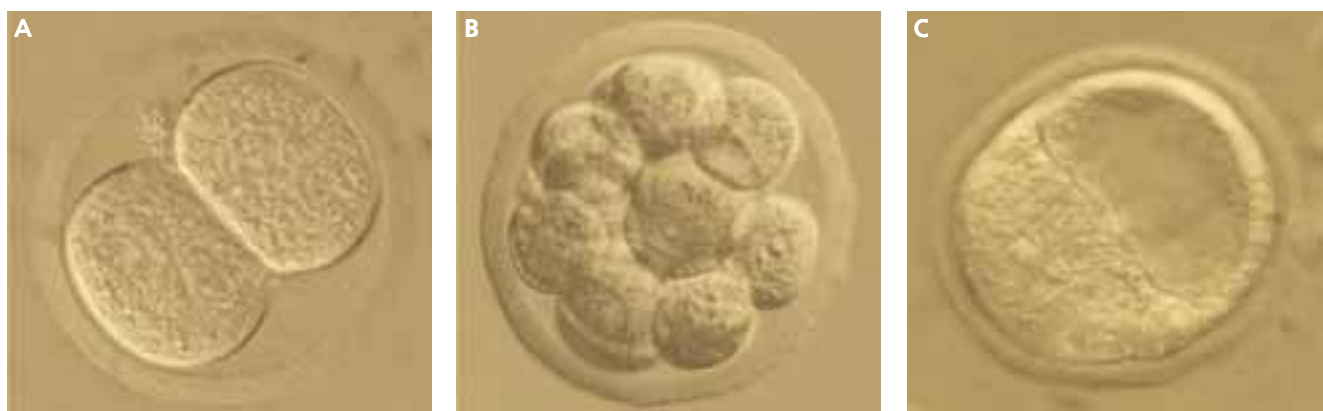
Figura 1. Embrión de ratón en tres etapas diferentes. A: Embrión de un día que contiene dos células. B: Embrión de dos días en fase de mórula. C: Embrión de tres días en fase de blastocisto. El acúmulo de tejido en la base de la esfera es la masa celular interna

mano. La idea más aceptada actualmente, aunque todavía con base científica débil, es que posiblemente en todos los órganos de nuestro cuerpo existan células madre o progenitoras responsables de la capacidad de regeneración (mayor o menor) de los mismos. Se desconoce por el momento la verdadera pluripotencialidad de las células madre adultas. Las células madre mesenquimales mencionadas anteriormente están siendo objeto de estudio de forma especialmente intensa porque en determinadas condiciones experimentales pueden convertirse en células de otros tejidos (como neuronas o músculo cardíaco). La verdadera potencialidad terapéutica de éstas células está, por el momento, sometida a debate.